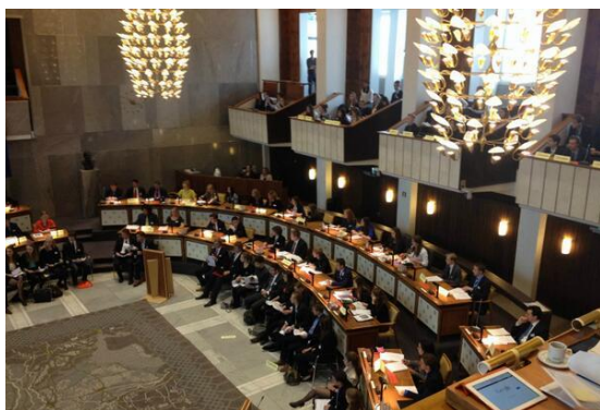
Delegatieleden in het provinciehuis van Gelderland tijdens de provinciale MEP-conferentie Gelderland.

Kijk voor meer informatie op: www.mepnederland.nl/provincialeconferentie