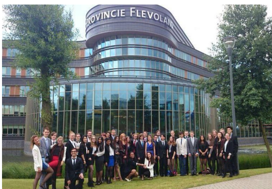
De delegatieleden van de provinciale MEP-conferentie Flevoland voor het Provinciehuis van Flevoland.