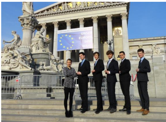
De Nederlandse delegatie en commissievoorzitter voor het Oostenrijkse parlement in Wenen.

Op de website is het volledige verslag geplaatst. Kijk hiervoor op: www.mepnederland.nl/wenen