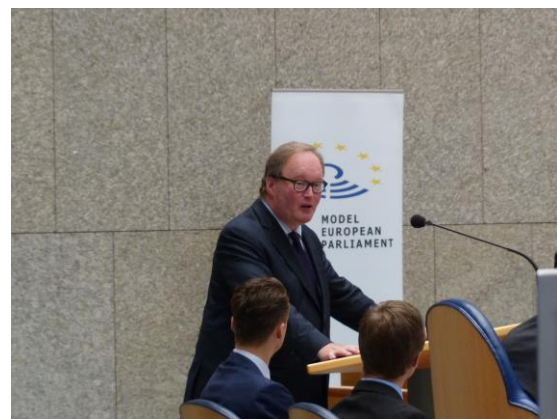
Europarlementariër Van Baalen tijdens de sluiting.