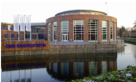
CSG Reggesteyn, Nijverdal (Overijssel)