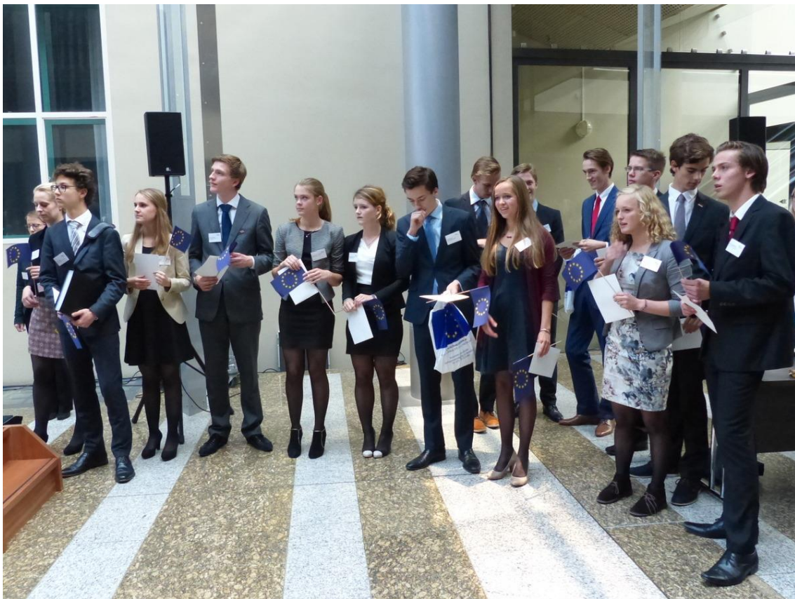
De geselecteerden na afloop van de nationale MEP-conferentie in de Statthal van de Tweede Kamer.

De deelnemers verblijven ook hier in gastgezinnen en zijn zelf verantwoordelijk voor de bekostiging van hun reis, waarbij ze in veel gevallen tegemoet worden gekomen door de eigen school.