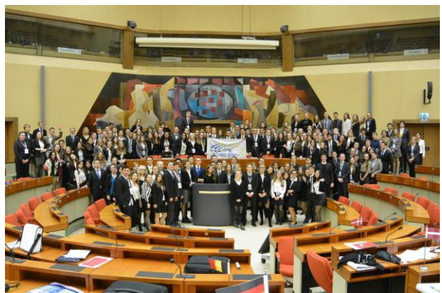
Het voltallige MEP bijeen in de Hémicycle, het voormalig Europees Parlement in Luxemburg.