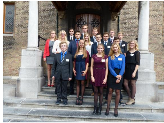
Delegatieleden van de provincie Overijssel.