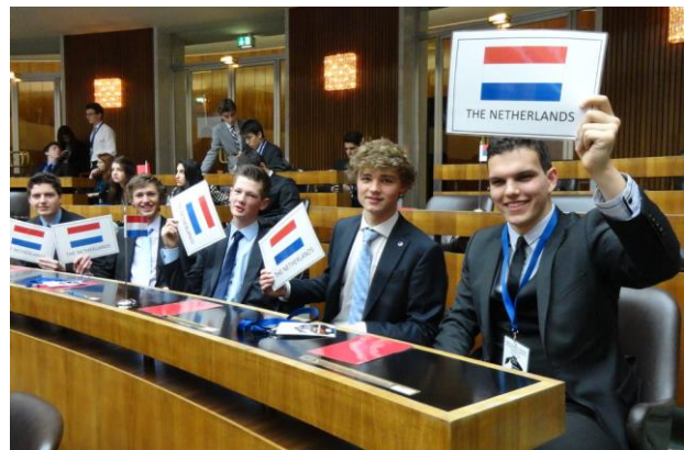
En tijdens de Algemene Vergadering.