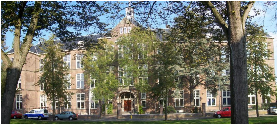
GSG Leo Vroman, Gouda (Zuid-Holland)