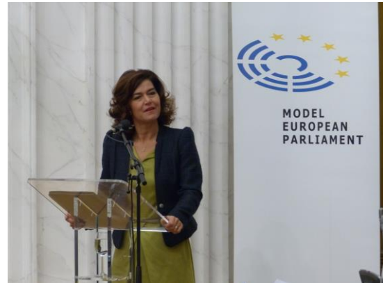
Tweede Kamervoorzitter van Miltenburg opent de Algemene Vergadering.