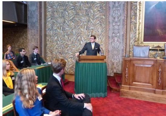
Z.E. Francesco Azzarello, Ambassadeur van Italië, spreekt de deelnemers in de Eerste Kamer toe.

Traditiegetrouw bood de Eerste Kamer ook in 2014 de vergaderzaal aan voor de officiële opening van de nationale conferentie. Na een welkom van de voorzitter van de Eerste Kamer, sprak de ambassadeur van de EU-lidstaat die het voorzitterschap van de Raad van de EU bekleedt, in dit geval Italië, het MEP toe. Vervolgens kregen de jongeren zelf het woord. Van iedere provinciale delegatie presenteerde het delegatiehoofd het eigen land, waarbij kenmerken van de verschillende EU-lidstaten de revue passeerden, maar ook vooroordelen werden weerlegd.