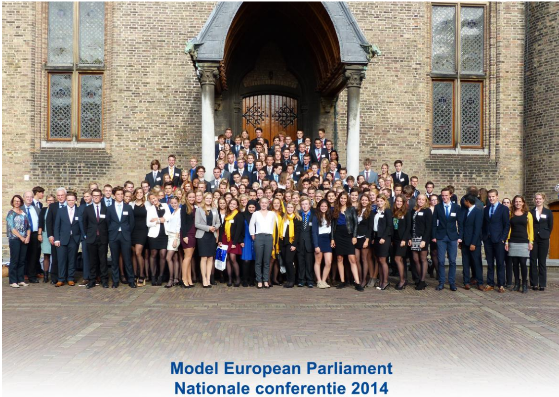
Model European Parliament Nationale conferentie 2014