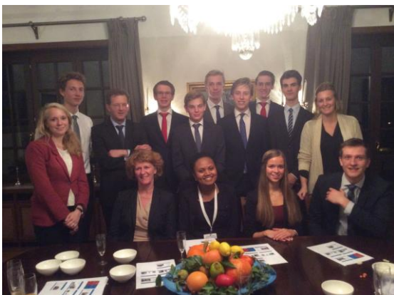
Ontvangst van de Nederlandse delegatie op de residentie van de Nederlandse ambassadeur in Luxemburg

Op de website is het volledige verslag geplaatst. Kijk hiervoor op: www.mepnederland.nl/luxemburg