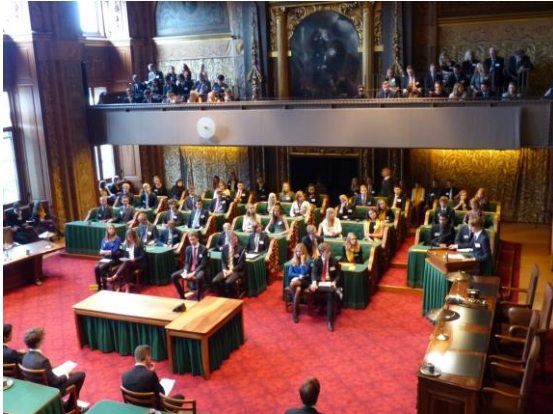
De opening in de vergaderzaal van de Eerste Kamer.