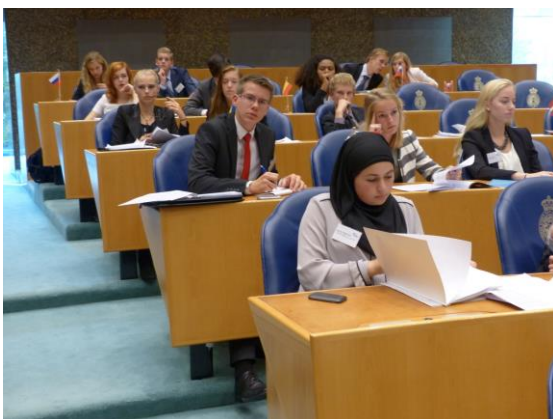
Debat in de vergaderzaal van de Tweede Kamer.