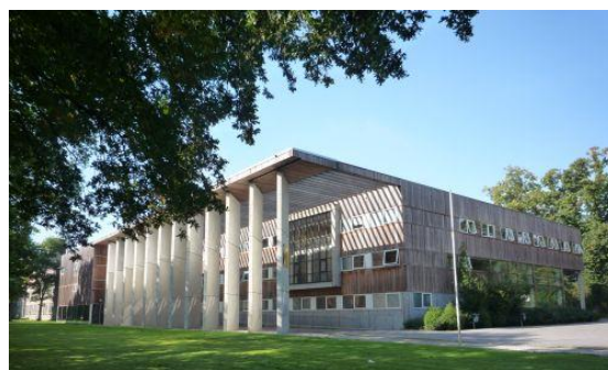
Maartenscollege, Haren (Groningen)