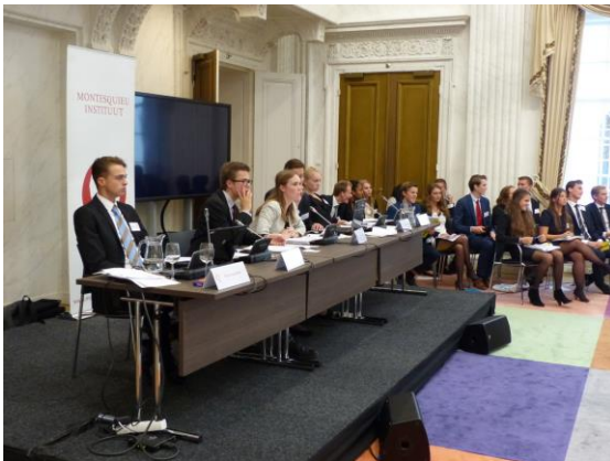
Presidium en commissie volgen het debat in de zaal.