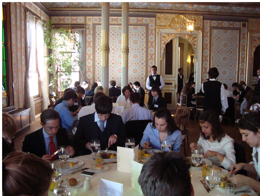
Lunch at the Sait Halim Paşa Yalısı