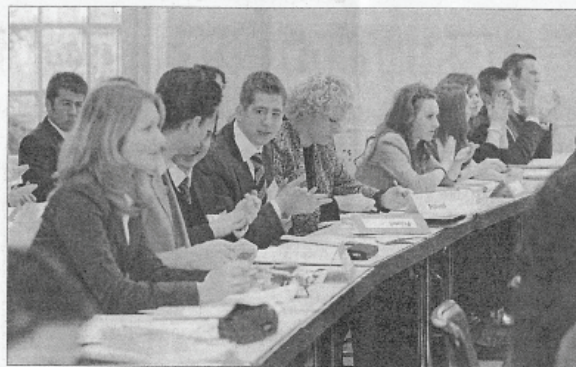
Wie die richtigen EU-Politiker: Jugendliche aus rund 30 Ländern diskutieren im Alten Plenarsaal.