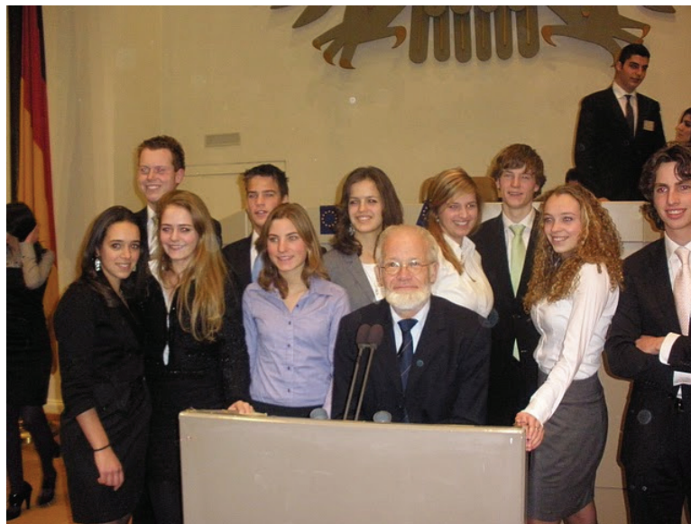
De Nederlandse deelnemers aan het Model European Parliament Bonn

The day after we finished our resolution, which was without too much trouble, we had our delegation meetings. They were held at the Friedrich-Elbert-Gymnasium, the school that hosted the MEP this year in Bonn. Every resolution was discussed, and each and every one of us had the opportunity to ask questions or answer them. It was a very productive meeting in which we got the information needed to write speeches against a resolution, or amendments. The General Assembly was held in the "Wasserwerk", former assembly hall of the German Federal Republic, and the building was perfect for MEP. I was lucky enough to be in the committee which had to present their resolution first. It was very exciting to start out the General Assembly, and I noticed that everybody was very attentive during these two days. Most of the resolutions passed, but some were not flawless and this started some debates with very interesting results. Nonetheless, we were all very honest and respected each other. After the General Assembly we were all very sad because of the end of the week. But, it was closed with a great party at the hospitable School, the Friedrich-Ebert-Gymnasium.