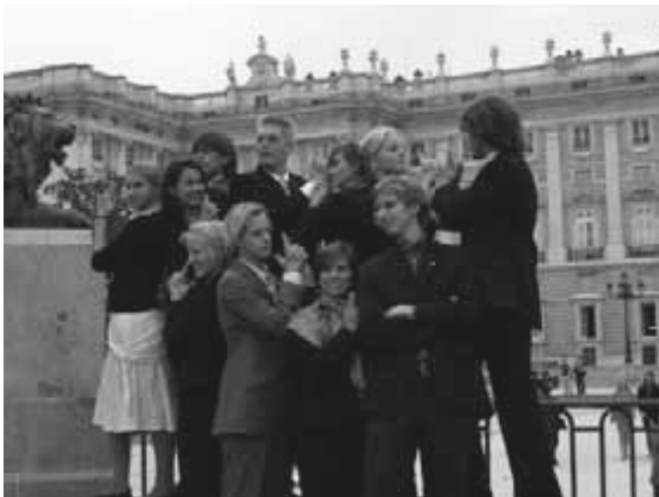
The Dutch and Austrian delegation in front of the Royal Palace

The Dutch participants are unanimous in their opinion that the MEP Madrid was an unforgettable time. We all look back and regret that it ended. We made loads of new friends, especially with the Austrian delegation. The MEP was such an amazing experience for us. We really feel much wiser now, and not only about the EU. We just have no words.