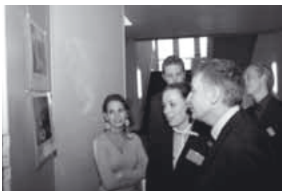
Ambassaderaad Akil Öktem van de Ambassade van Turkije, bezichtigt samen met delegatieleden uit Zuid-Holland, foto's van hun bezoek aan de regio Izmir.

Tijdens de provinciale MEP conferentie in het provinciehuis van Zuid-Holland, werd de fototentoonstelling van het bezoek van Zuid-Holland aan Turkije – ook in het kader van het Europroject – geopend door de Ambassaderaad, de heer Akil Öktem.