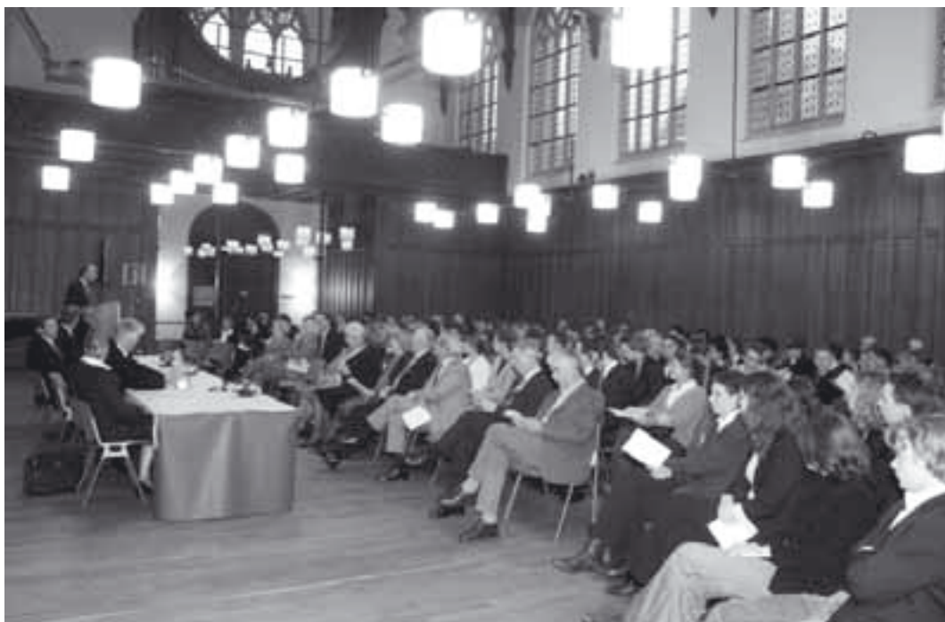
Voorzitter Jacobovits de Szeged opent de nationale manifestatie in de Gotische Zaal van de Raad van State.

De manifestatie werd afgesloten met een druk bezochte receptie, waarbij ook veel ambassadeurs of vertegenwoordigers van EU-ambassades in Den Haag aanwezig waren. In de receptieruimte was een expositie van 15 jaar Model European Parliament Nederland, met bijdragen uit alle provincies.