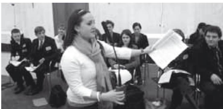
Vragen van de Ierse delegatie tijdens de Algemene Vergadering

Tijdens de internationale conferentie van het MEP heb ik een heleboel nieuwe mensen leren kennen. Ze hebben me dingen geleerd (ik ken nu een Ierse mythe!), ze hebben me verrast met hun cultuur en gewoonten (hoezo, je eet nooit chocoladevla?) en hebben me soms verstedeld doen staan van hun opvattingen en meningen. Maar boven alles, en daar ben ik ze heel dankbaar voor, hebben ze ervoor gezorgd dat ik een fantastische MEP-week heb kunnen meemaken!