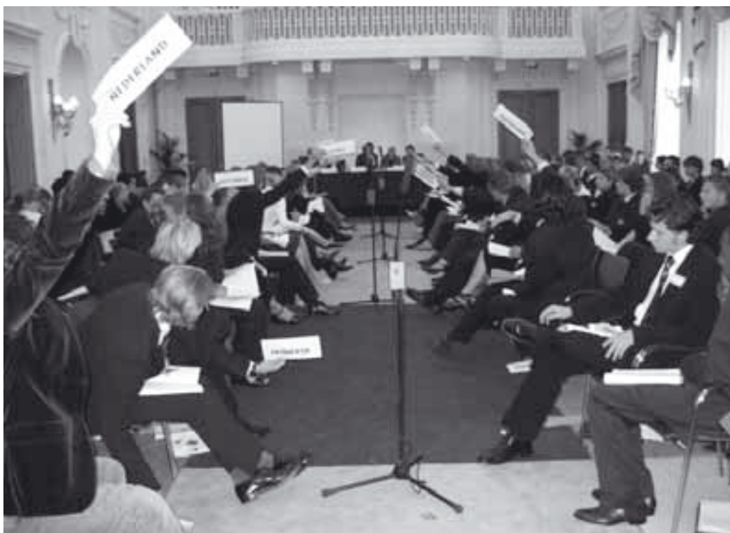
Geanimeerde discussie in de Algemene Vergadering van de nationale MEP conferentie