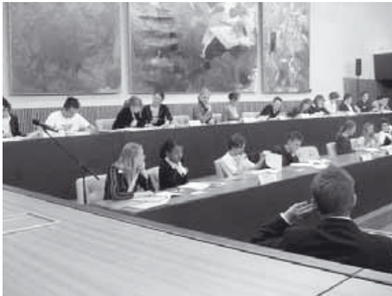
Algemene Vergadering MEP Overijssel 2005 in het Provinciehuis te Zwolle