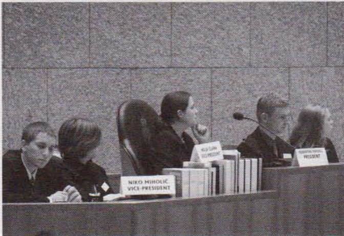
Het Presidium van de Algemene Vergadering