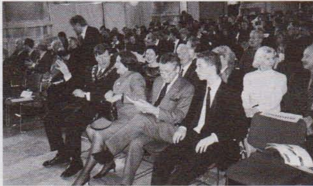
Openingsceremonie in de St. Laurenskerk in Rotterdam