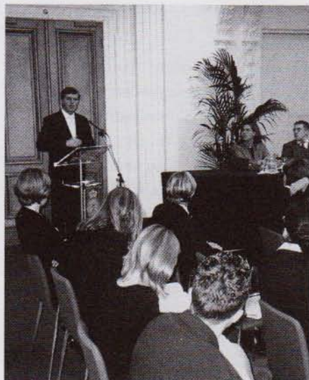
Drs. L.M. Hermans – Minister van Onderwijs, Cultuur en Wetenschappen – spreekt de Algemene Vergadering toe in de Oude Vergaderzaal van de Tweede Kamer der Staten-Generaal

Tijdens de zittingen van het Model European Parliament in de verschillende provincies wordt de afvaardiging naar de nationale conferentie gekozen. Vervolgens vindt weer een selectie plaats voor deelname aan het internationale parlement dat twee keer per jaar bijeenkomt.