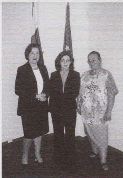
Mevrouw M. Kuneva (midden) – de Bulgaarse Staatssecretaris van Europese Zaken – ontvangt de secretaris-generaal van de MEP Foundation (links) en de rector van de First English Language School (rechts)